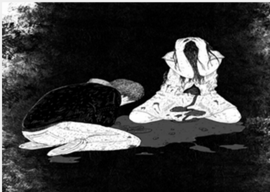
Ilustración Flecha Roja

Cadáveres de caricias que los aleja el remo de los días